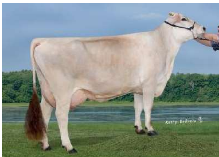
MATKA: AMBER RAE HIGH SOCIETY ET