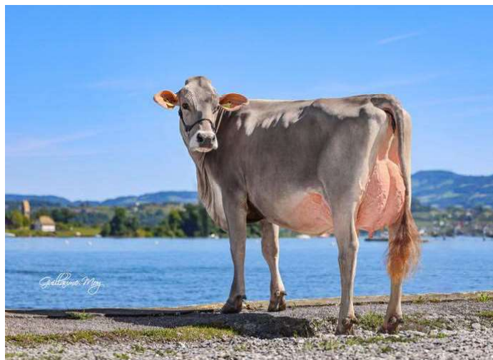
HACKI BS BRICE NATALIE