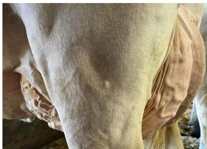
MATKA HILTOP AVRES S NUTELLA 'E 90 E 91 MS'