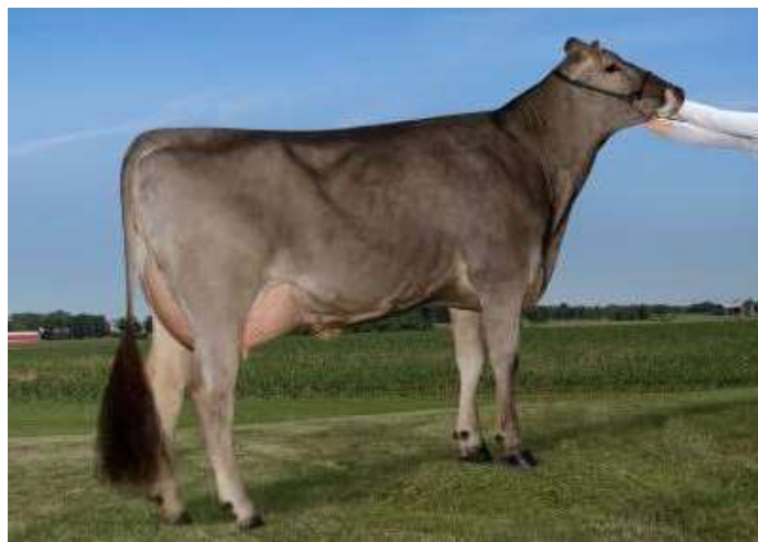
PRABABIČKA: NORBERT BIVER SASSY