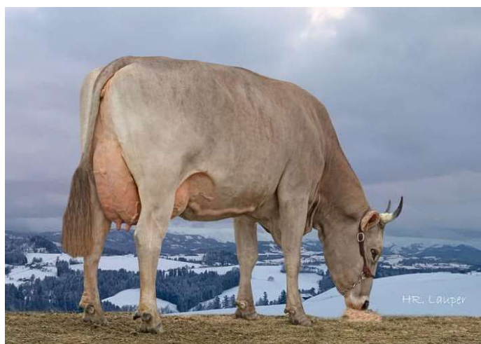
MATKA BURGLERS LORDAN URMI