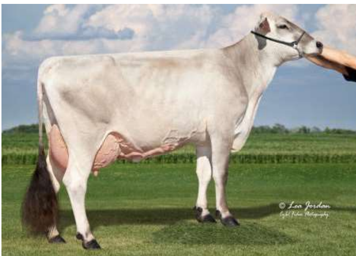
MATKA PERRY BROOK LUCKY INDIA V87