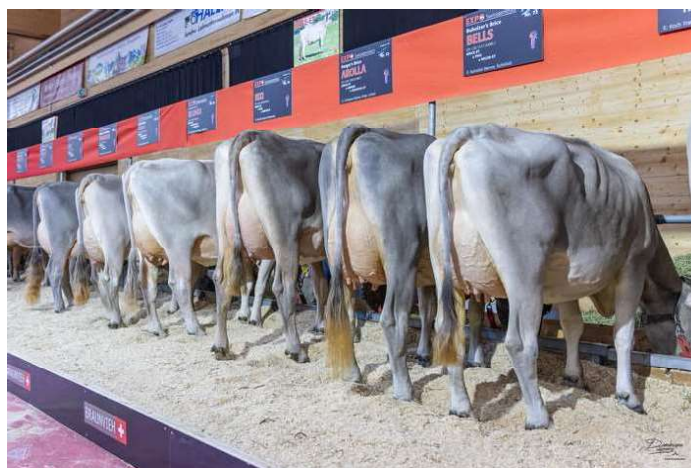
DCERY BÝKA BRICE NA EXPO SWISSGENETICS 2023