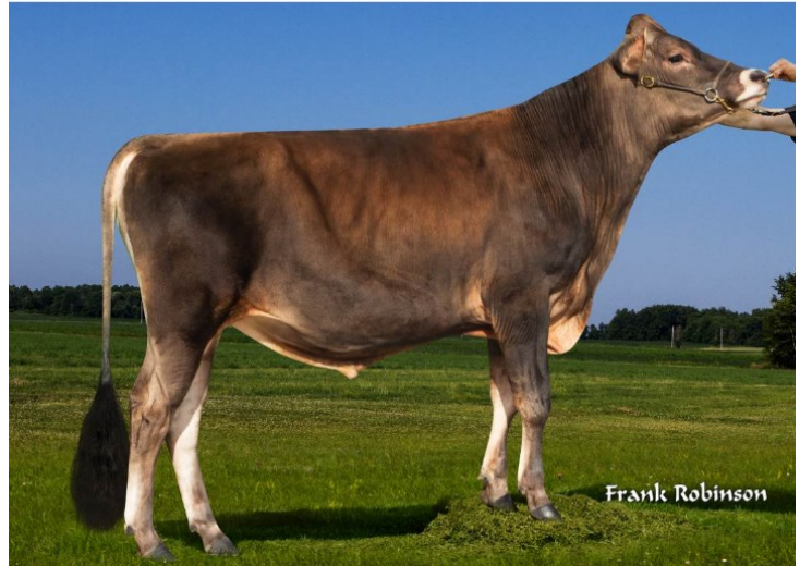
Sexing Sd Ender-ET